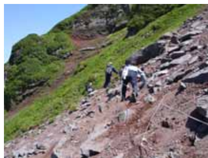
親不知子不知中間