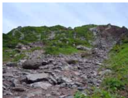
落石源となっている崩落地