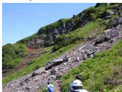
親不知子不知入口