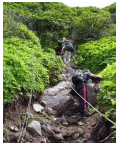
侵食の激しい直登部分

・頂上周辺の進入禁止箇所には、黄色と黒のロープを張っています。祠の後方へは絶対にまわらないで下さい。また、南峰は立入り禁止となっていますので絶対に立ち入らないで下さい。