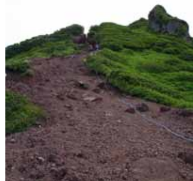
火山灰が剥き出しの合流点