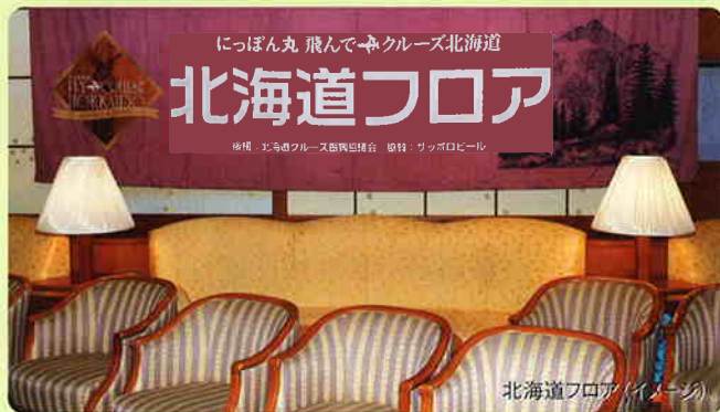
北海道フロア(イメージ)

北海道の旬の食材の無料試食タイムや、利尻島の子供達による心あたたまる歓迎イベント、今年から実施する新イベント(予定)をお楽しみください。