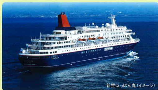
新生にっぽん丸(イメージ)

生まれ変わった客室、楽しさの幅が広がるパブリックスペース、気分に合わせて選べる美食の数々。新しいにっぽん丸の「飛んでクルーズ北海道」にご期待ください。