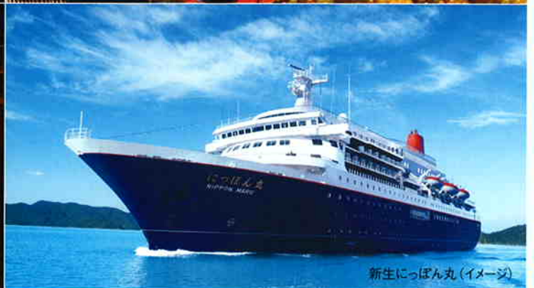
新生にっぽん丸(イメージ)